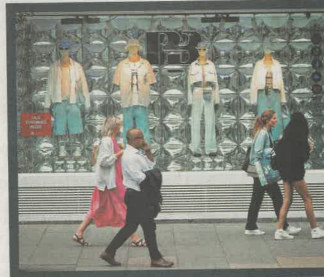
全球 GDP 增長趨勢