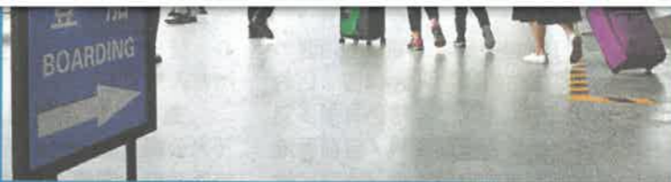
▲現時旅客可從大灣區9個口岸碼頭，乘快船直達香港國際機場

至於香港航空，去年與珠江客運合作推出「優悠通」代碼共享計劃，將香港國際機場與大灣區6個主要客運碼頭共享相連，包括深圳蛇口、深圳福永、廣州蓮花山、廣州南沙、中山及東莞虎門。