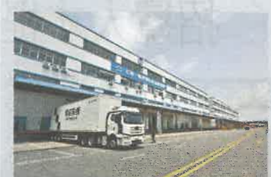
▲貨物在東莞物流園完成安檢等程序後，直送香港機場出口。

• 未來會進一步擴展香港國際機場在內地城市的候機網絡，有關網點將由現時19個增加至30個