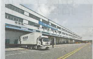
▲貨物在東莞物流園完成安檢等程序後，直送香港機場出口。