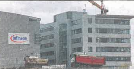
德國致力提升芯片自主程度，半導體設備商英飛凌在德累斯頓開設新工廠，據報涉資50億歐元。

為減少在芯片上對亞洲的依賴，德國力邀各國芯片企業在當地投資設廠，惟發展芯片供應鏈，涉及愈來愈龐大的開支，帶來的自主程度提升卻有限，惹來質疑。歐盟已訂下目標，希望2030年其芯片產量佔全球市場兩成，歐洲最大經濟體德國有積極行動，德國半導體