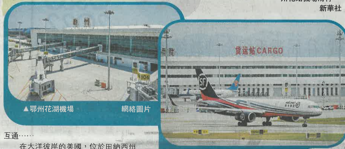
▲鄂州花湖機場

其中，機場工程採用建築資訊模型(BIM)技術，設計階段搭建數字機場模型，竣工時形成現實、電腦中精準融合的兩個「孿生」機場。機場東、西兩條遠距跑道下面埋設了5萬多個感測器，可實時掌握飛機的載重量、飛機降落時對跑道的衝擊力、飛機在跑道的運作軌跡和速度，以及對跑道異物進行探測並及時提出報警。