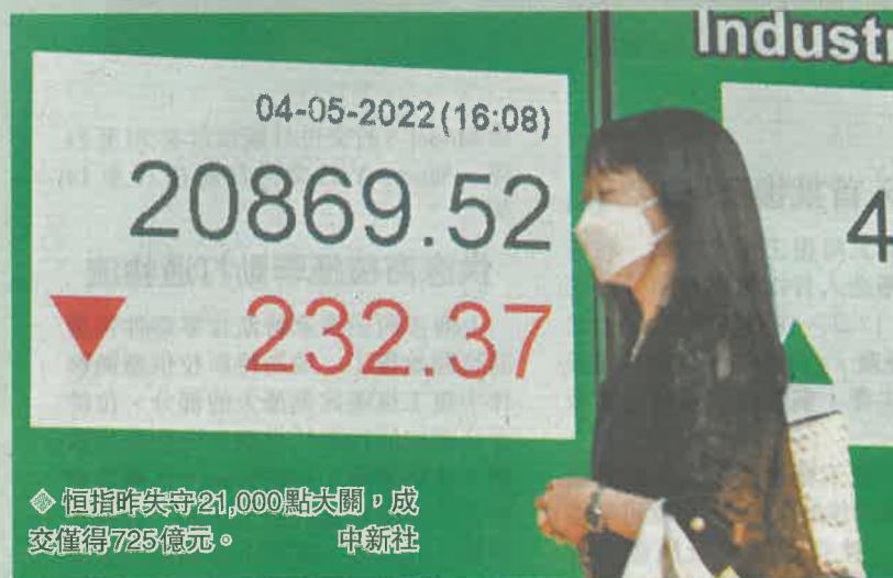
◆ 恒指昨失守21,000點大關，成交僅得725億元。

◆ 港股五連升後回落。市場主要靜候美國將公布的議息結果，由於投資者都預期今次加息幅度將達半厘，並宣布「收水」進程，故傾向先行減磅。恒指昨最多跌近330點，收市仍跌232點，報20,869點，失守21,000點大關。「港股通」繼續暫停，加上股民抱觀望態度，成交較上日減32%，僅得725億元，是今年最低的全日市成交。聯儲局公布議息結果前，港匯繼續下行，昨曾觸及7.8487水平，是逾兩年半以來最弱。 ◆ 香港文匯報記者 周紹基