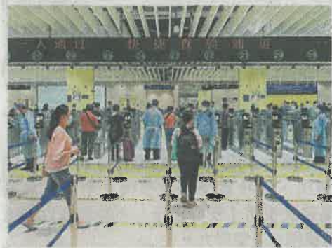
▲調查發現，通關與否並非初創企業首先要考慮的因素。

大部分大灣區初創企業（81%）均滿意各自城市的創業生態系統，香港初創企業對香港專業服務的評價最高。調查同時發現，