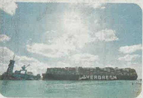
●全球航運緊張，導致運輸成本大幅增加。圖為今年3月一艘貨船在蘇伊士運河上擱淺，令航運業更添壓力。

他說，現時骨牌效應已逐漸影響港人日常生活，「以啤酒為例，本港有逾百款啤酒售賣，當中一兩款缺貨，對市民而言只是選擇上稍受影響，但實際卻是一個警號，難以想像之後會如何發展，更不知道下批貨物幾錢上船。」